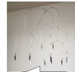
この先に何を はさもう...??

モビールに光を当てると、その動きと共に光の表情も変わり、美しさを増します。また、壁にうつったモビールの影もまた、美しく変化あるフォルムを見せてくれるのです。さらには、音楽もその魅力を後押しするでしょう。音楽に合わせて、モビール達が躍る様子が見られるかもしれませんね。BGMをかけながら、モビールのある空間を堪能すれば、また一段と贅沢なひとときを過ごせることでしょう。