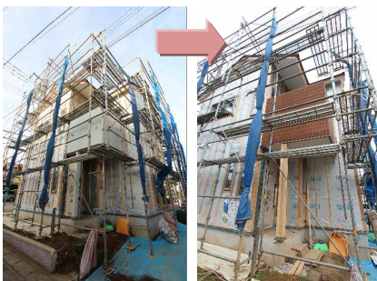
アクセントの杉板は下地で準防火性能を

ドを貼り、さらにその上に板金を施し準防火性能を満たしました。このように建築に制限のある地域でも、お施主様にご納得のいただけるオーダーワンの家造り。弊社がめざす家造りの思いが詰まった家となりそうです。