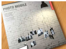
モビール フォトクリップ

有名デザイナーや専門作家によるスタイリッシュな作品もたくさん。世界的な有名ブランドは、デンマークのフレンステッドモビール (Flensted Mobiles)。北欧スタイルのユニークなデザインやカラフルなものが多数あり、とても人気です。ザ バターフライング (The Butter Flying) のモビールは、その色や形が優しい印象のものも多く、赤ちゃんのベッドメリーや子供部屋のインテリアとしても好まれています。また、日本初のモビールブランドとされるテンポ (tempo) は、オリジナリティに溢れる空間美を演出させてくれるモビールが多くあります。また、ハンドメイドがお好きな方は、手作りモビールにチャレンジしてみても。モビール作りのための書籍や、型紙がダウンロードできるサイトもあるようです。